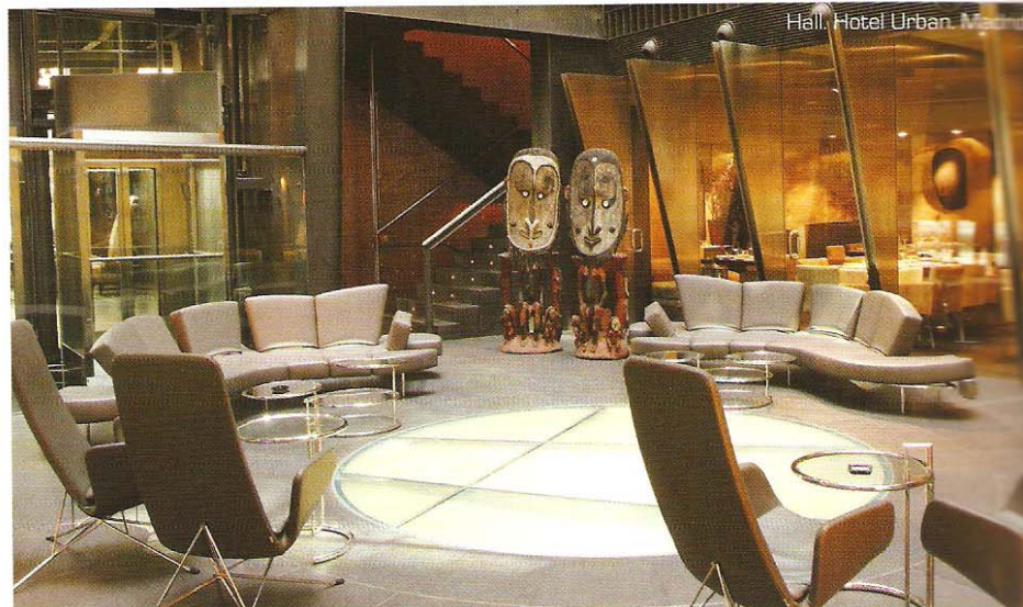
Hall, Hotel Urban, Madrid