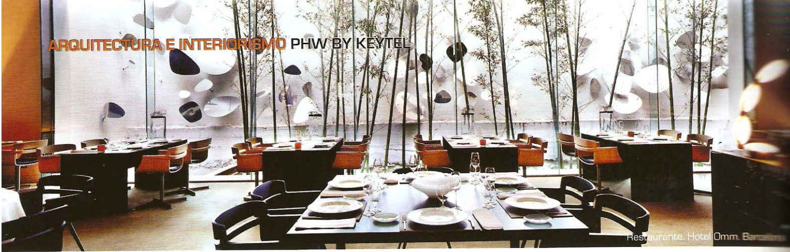
Restaurante, Hotel Omm, Barcelona