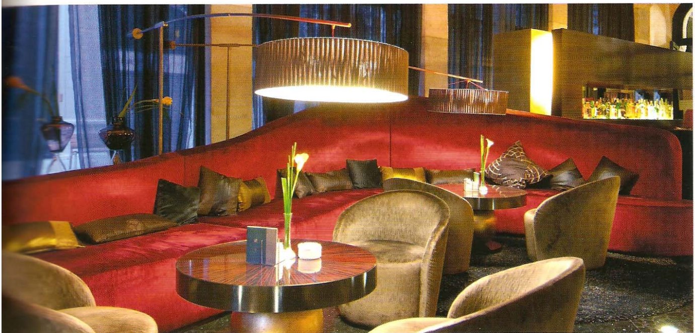
Café Vienés. Hotel Casa Fuster. Barcelona

Prestige Hotels of the World by Keytel (PHW) recoge una exclusiva selección de hoteles en todo el mundo, establecimientos cuyo denominador común es su reconocido prestigio en su ámbito geográfico gracias a su historia, ubicación, nivel de servicio, especialización, así como el diseño interior, que destaca especialmente en algunos de sus hoteles más lujosos catalogados como cinco estrellas