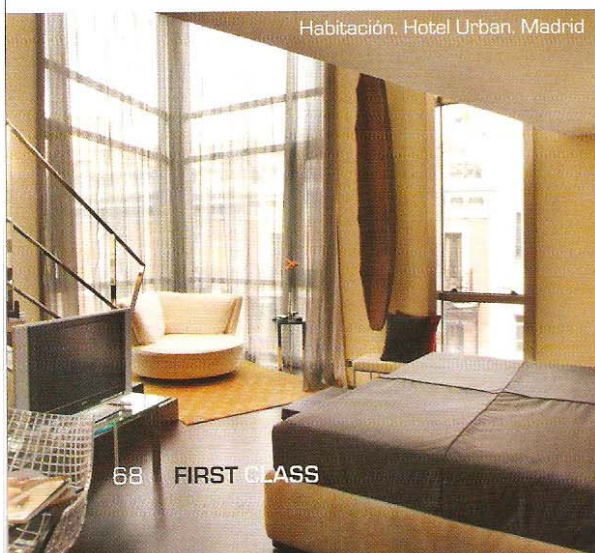
Habitación, Hotel Urban, Madrid

Cuenta con una sala de ébano donde se puede apreciar una selección de antigüedades egipcias de diferentes épocas como una estatua de granito del Faraón Ramsés II que data del siglo XII a.C., una figura del Dios Osiris de bronce y piedras semipreciosas, del siglo VIII a.C., o distintos relieves parietales de caliza de varias dinastías egipcias. Se trata de una pequeña colección de doce obras cuya contemplación resulta realmente deliciosa gracias a su belleza.