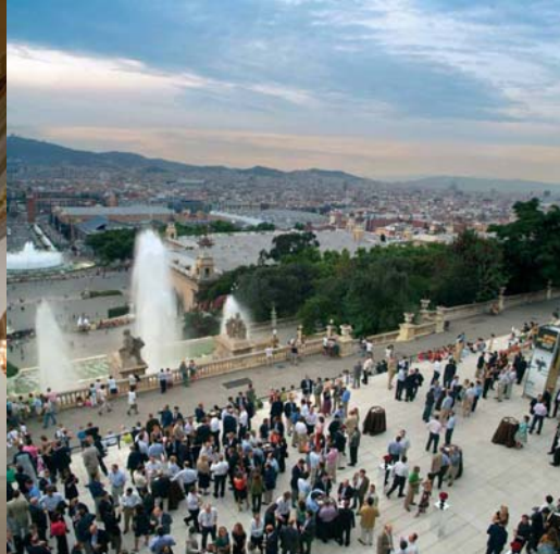
Fotografía del vestíbulo y de la terraza del MNAC. Lugar a realizar el evento PHW