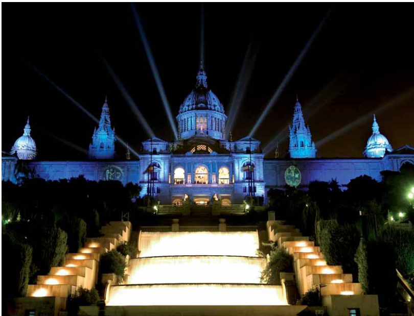
Fotografía nocturna del edificio de noche. Lugar a realizar el evento PHW